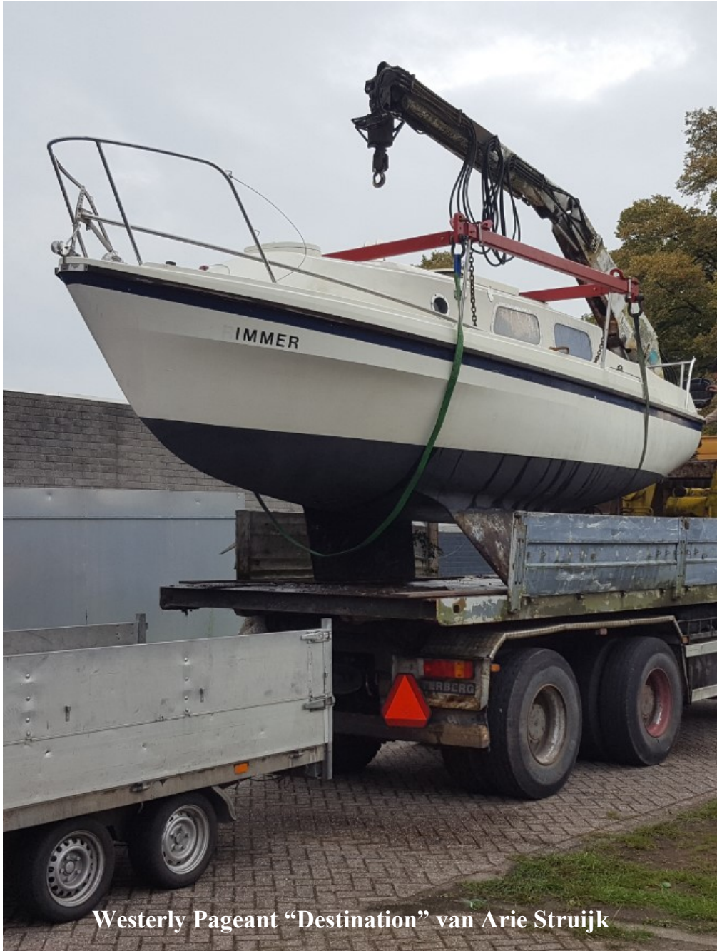
Westerly Pageant "Destination" van Arie Struijk