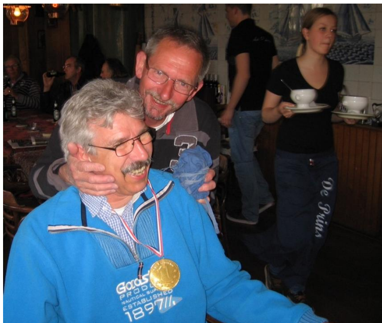
Dit is een prijsuitreiking Hemelvaart

Deze keer verzamelen we op 30 mei in de Pekelharinghaven te Medemblik, hier wacht een steigerborrel met de nodige verhalen.